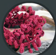
Mireille Tanner-Girod ESPACE ROUGE